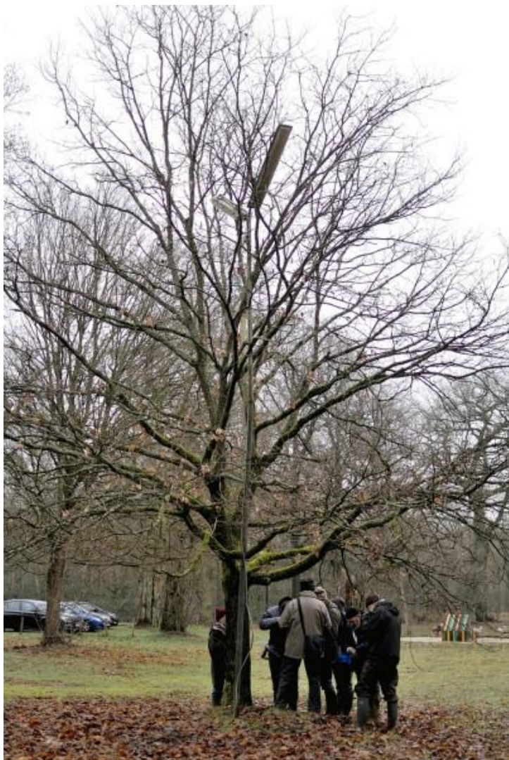
Deze boom was gelukkig goed verlicht