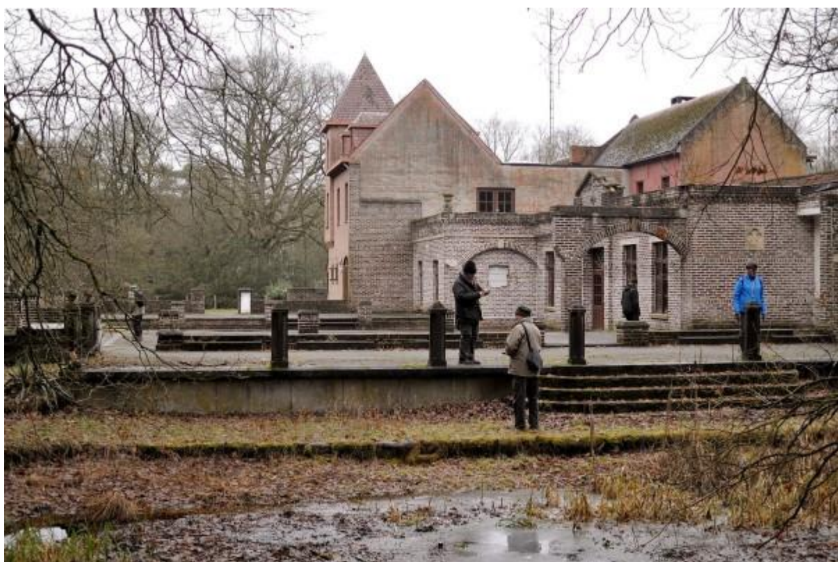
De mosjes op het gebouw verdienen een volgende keer zeker nog wat aandacht.